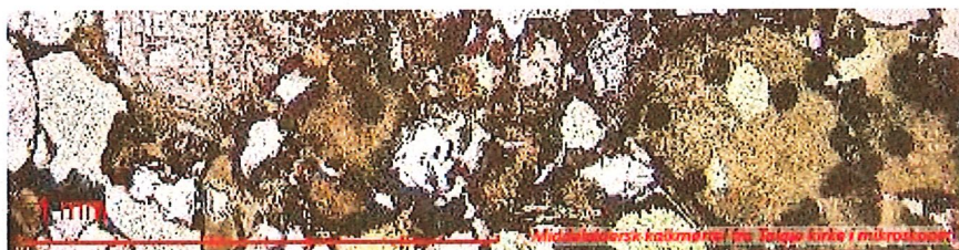
Middelalderens kalkmørtler fra Tolga kirke i mikroskop

Prosjektet utføres i løpet av en periode på 3 år (2025-2027) og har en ramme på 3,7 mill. kr.